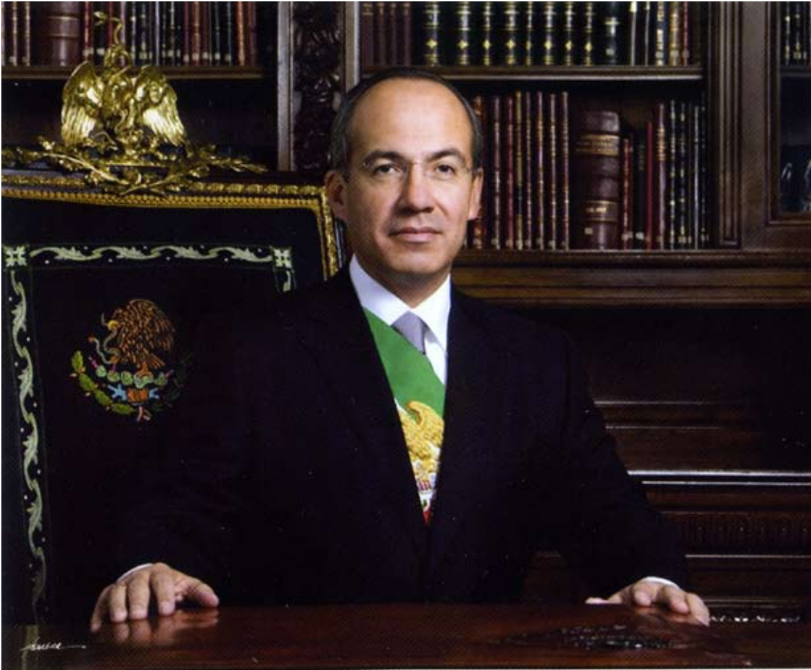
Mtro. Felipe Calderón Hinojosa Presidente de la República Mexicana