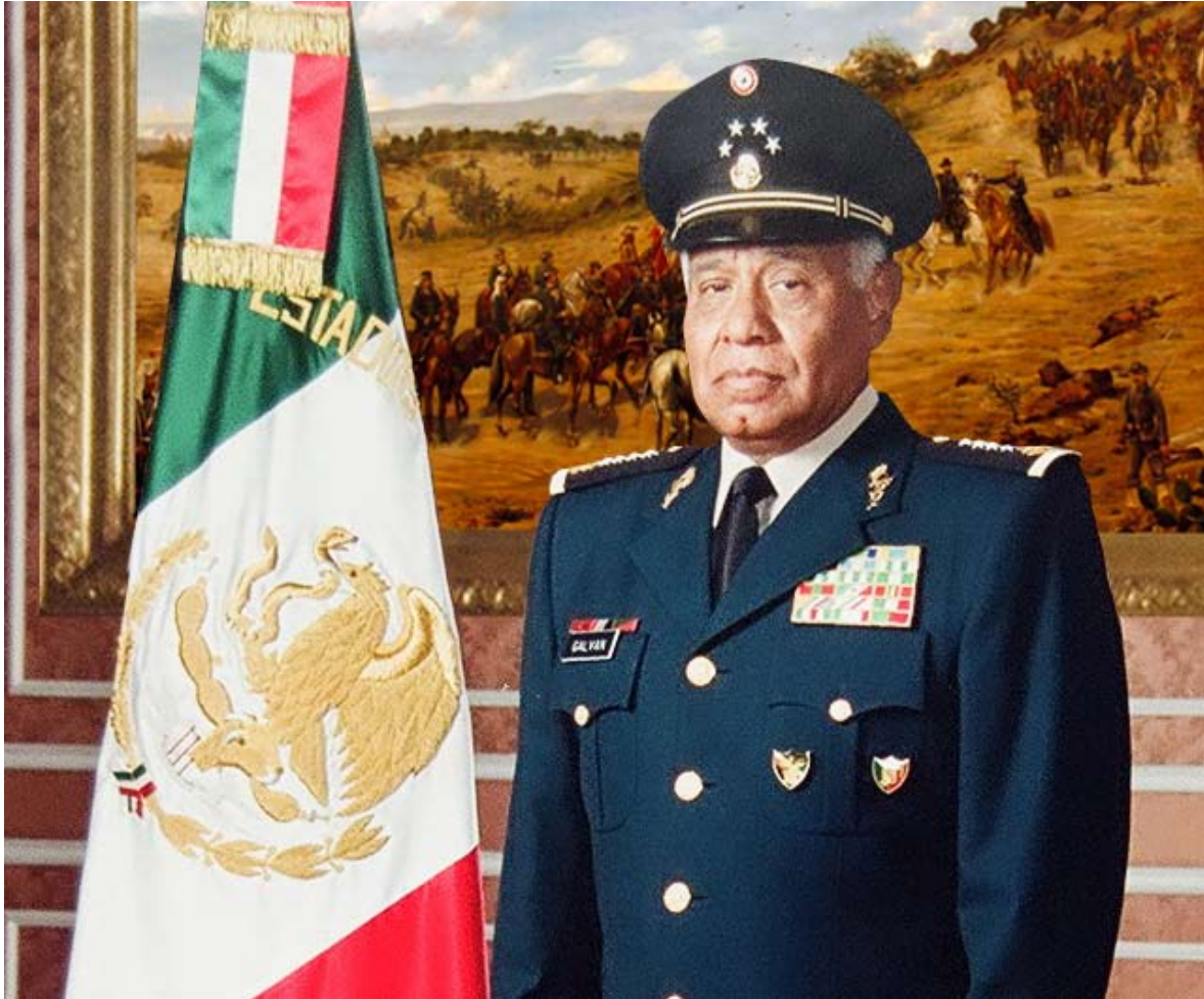
Gral. Guillermo Galván Galván Secretario de la Defensa Nacional